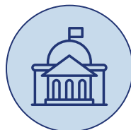
부문별 대상 8개 기관