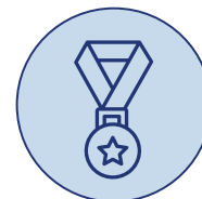
감사품질 특별상 2개 기관&개인