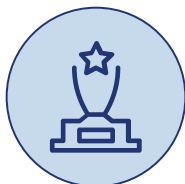
내부통제경영 대상 2개 기관&개인

내부통제경영 시상식은 이러한 시대적 요구에 부응하기 위해 실제적 조직진단실사를 통해 내부통제 구축 및 건전운영실태를 간접적으로 입증하여 대외적 인증과 우수기관 선정 · 시상을 통해 투명하고 청렴한 대한민국 문화를 선도하는 것을 목적으로 합니다.